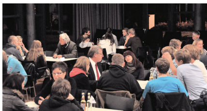
Soziales Lernen und fächerübergreifendes Arbeiten

Die Schwerpunkte der Veranstaltungen zur Berufs- und Studienorientierung liegen in den beiden ersten Halbjahren (Q1 und Q2): Anfang November findet in Zusammenarbeit mit dem Rotary-Club Marburg Schloss eine „Berufsbörse“ statt, bei der die Schüle-